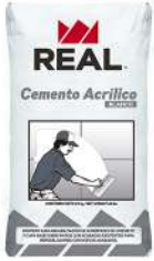
Saco de Cemento Acrílico BLANCO